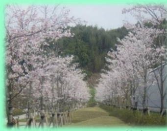
昨年の開花状況(桜)