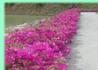
昨年の開花状況(ツツジ)