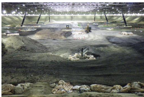
「エコアくまもと」 覆蓋施設埋立状況 (令和7年3月31日) ※埋立進捗率 52.6%

令和2年7月豪雨で発生した災害廃棄物については、令和5年3月末までに、54,588トンを受け入れました。