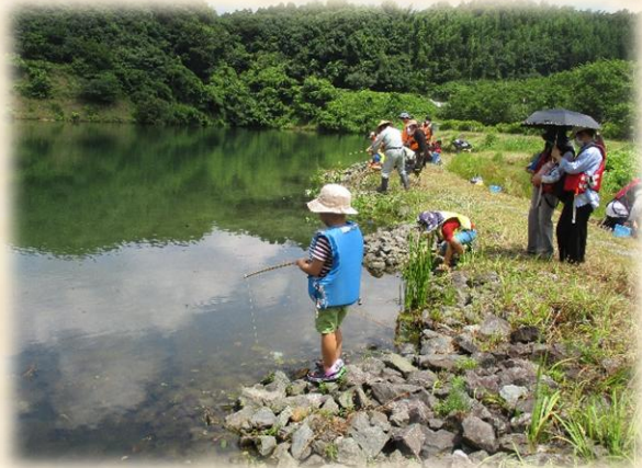
たくさん釣るぞー

○6月28日(土)に、今年1回目の「スジエビ釣り大会」を開催。天候にも恵まれ、たくさんスジエビをとることができ、参加者の皆さんにも大変喜んでいただきました。